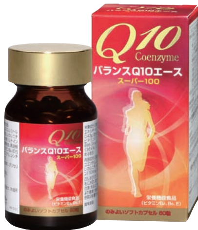
のみよいソフトカプセル