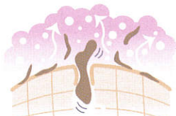
酸素を含んだ泡とともに 毛穴の汚れが…

ジェルが空気に触れたら、泡に変化！ お肌にのせてのばしていく間に、プクプクと 微細気泡が発生。酸素気泡のプクプク感を 感じながらマッサージしてみませんか？